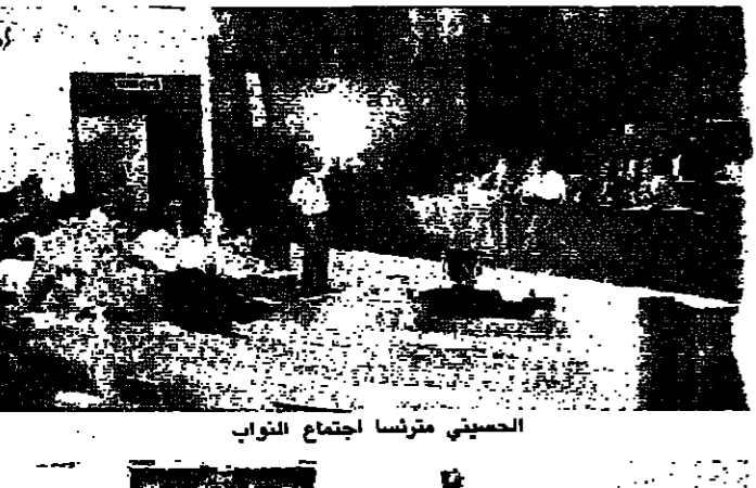
الحسيني يترأس اجتماع النواب